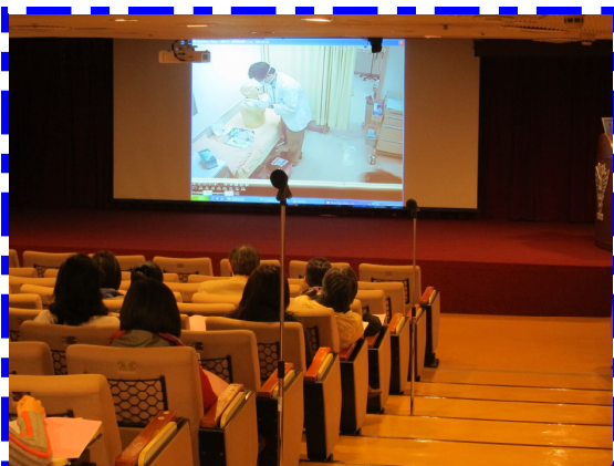
【觀看 OSCE 實際測驗影片】