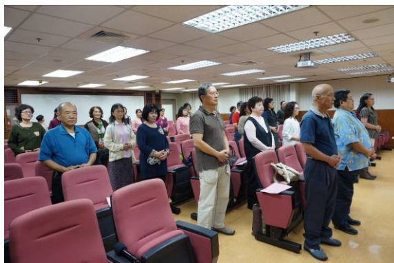
【課前動一動—培養情緒】