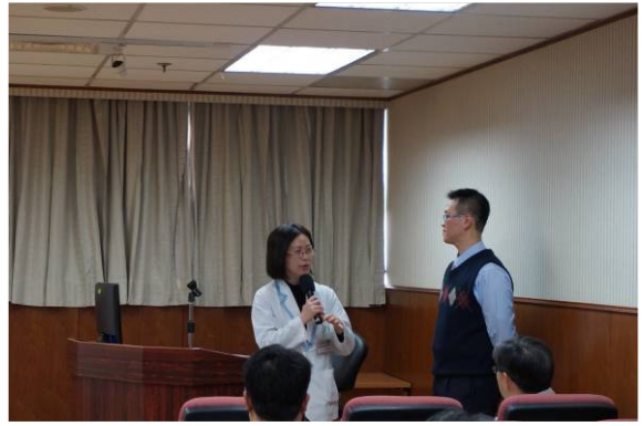
【院際交流：奇美藥劑部 VS 台大雲林藥劑部】